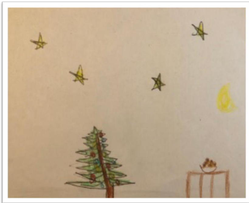
Von Lina (Klasse 2a)